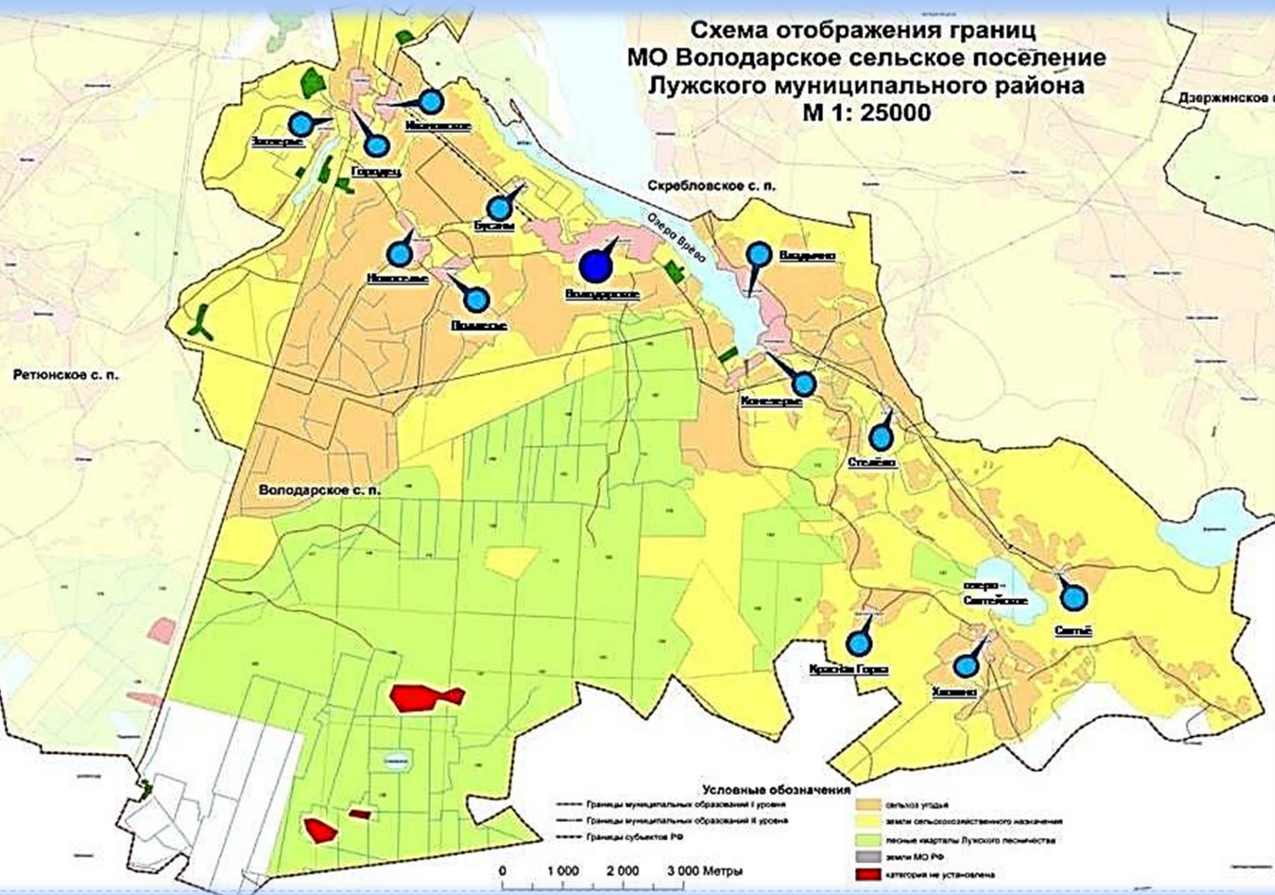
Схема отображения границ МО Володарское сельское поселение Лужского муниципального района М 1: 25000